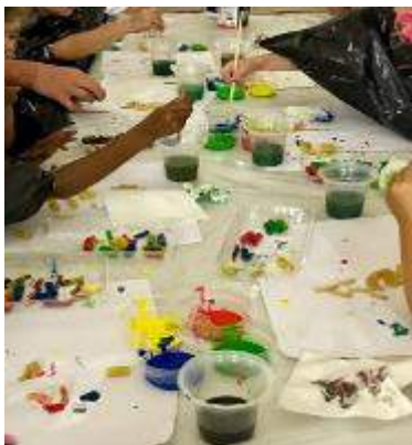
Kinders lekker aan die speel in 'n omgewing waar hul veilig en gekoester voel

Donderdae-aande word daar in ons heerlike fasiliteite 'n warm en huislike atmosfeer geskep wanneer almal vooraf lekker saamkuier en 'n lekker warm maaltyd geniet. Vriendskappe word hier gevorm wat onder "normale" omstandighede nooit sou gebeur nie. Daar word verby velkleur, kultuur, ryk-en-arm, die uiterlike en sosiale statusse gekyk; daar word met begrip en empatie na mekaar geluister. Mense en kinders wat nie meer kerk toe gaan nie, is opgewonde om Donderdae kerk toe te kom.