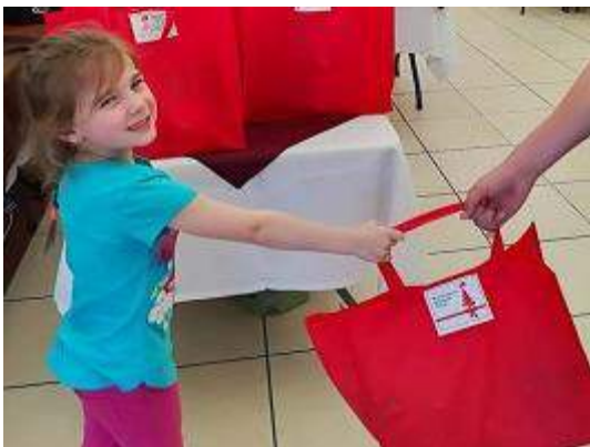
Bederfpakkies wat mense spesiaal laat voel