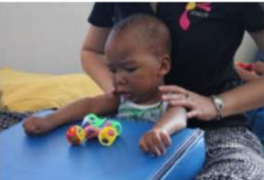
Ek kan nie my hande gebruik nie

Hierdie kinders het almal iets in gemeen: Elkeen is gebore met 'n gestremdheid.