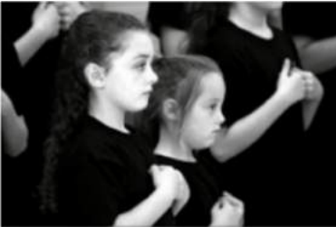
Ons kan nie hoor nie