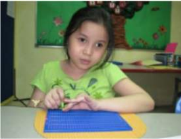
Ek kan nie sien nie